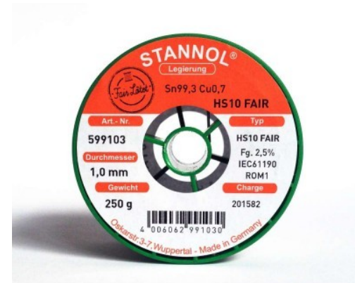
Bilder: Fairphone-Logo, Nager-IT-Logo, Rolle HS10 Fair FairLötet/Stannol

- FairLötet, HS10 Fair (Erfolgreicher Anstoß)